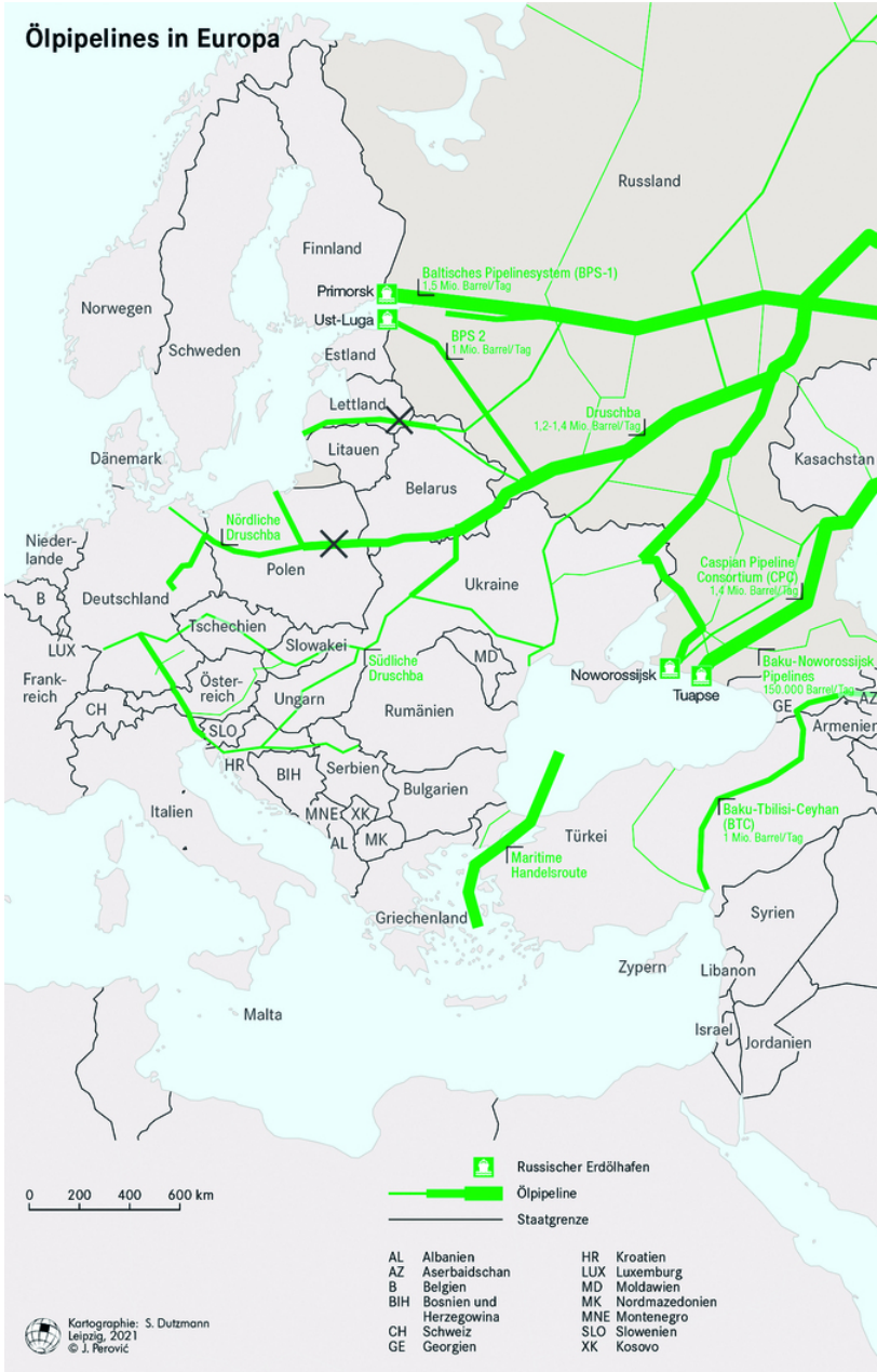
Abb. 1 Erdöltransportinfrastruktur Russland – Europa Die Markierung »X« bezeichnet eine Unterbrechung oder eine Reduzierung des derzeitigen Erdöflusses (Stand August 2024).