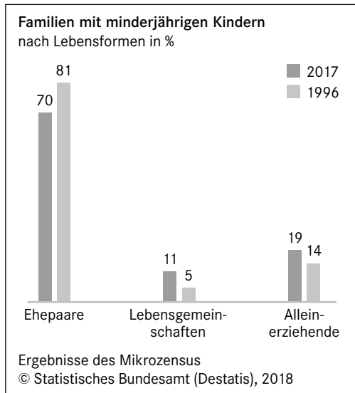
Abbildung 1: Familien mit minderjährigen Kindern nach Lebensformen in % (© Statistisches Bundesamt – Destatis, 2018)

Einen aktuellen Überblick ermöglicht die Abbildung 1, in der bereits die Zahlen von 2017 des Mikrozensus ausgewertet sind.