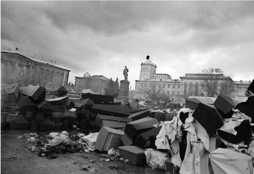
Abb. 1: Fotografie von Jurij Pavlov, Leninkan 12. Dezember 1988, in: PAVLOV, JURIJ: Kovčeg, Kaliningrad 2017, S. 136–137.